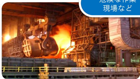
危険な作業 現場など