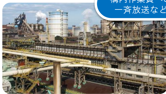
構内作業員への 一斉放送など