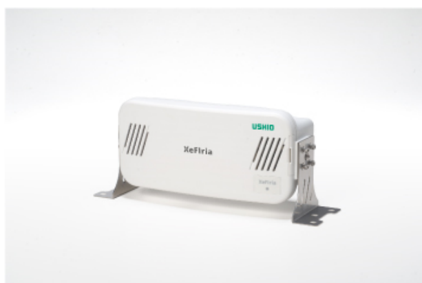
XeFlria mini (ゼフィリア・ミニ/常設タイプ)