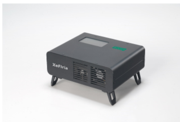
XeFlria zero (ゼフィリア・ゼロ/持ち運びタイプ)